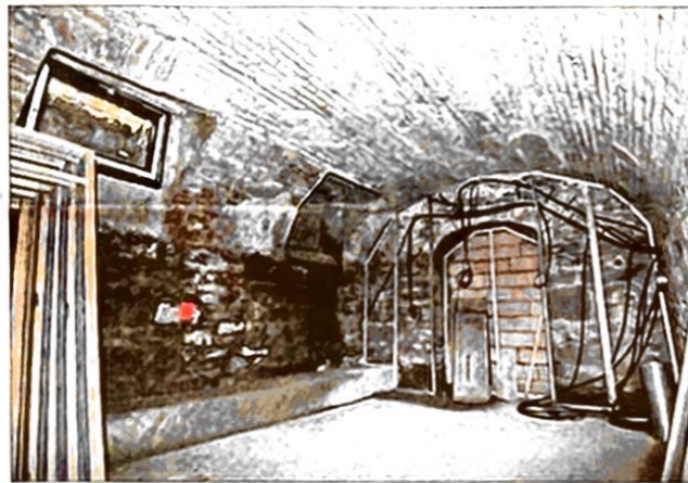
Au sous-sol se trouveront un sauna, un bar caché et une salle de sport. L'ambiance des pièces voûtées est particulière.

Marie-Hélène Engel et Florent Kesser poursuivent leur visite; ils se dirigent vers l'ascenseur historique, un Schindler, témoin des années folles, des années fastes. Imposant, l'équipement a été