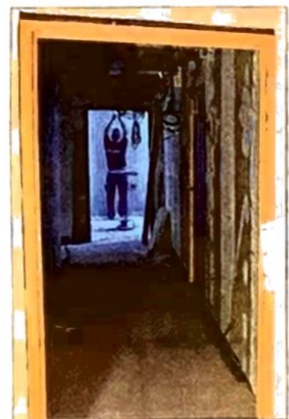
Sur le site, une soixantaine de personnes travaillent. Le chantier devrait arriver à sa fin en octobre.