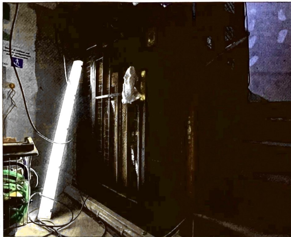
L'ascenseur historique du bâtiment a été conservé, un second est construit pour respecter le cahier des charges d'un hôtel quatre étoiles.